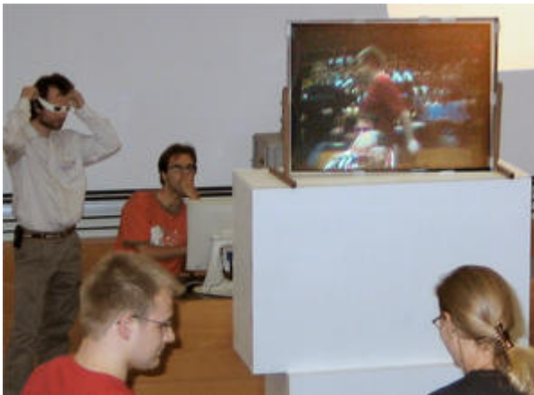
Ohne Brille sind auf der Leinwand zwei Bilder sichtbar, mit Brille nur eines auf jedem Auge. gross